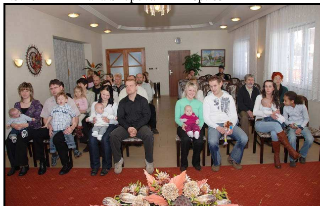
20. února jsme přivítali do řad lukaváků 4 nové občánky