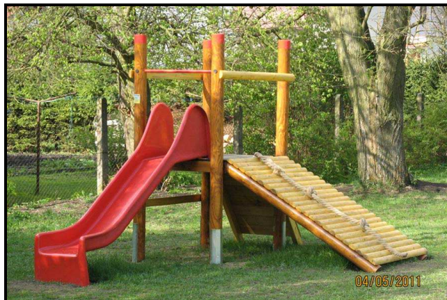
5. „Světlo na konci tunelu“. Nový herní prvek pořízený z výtěžku Lukavského plesu. Naštěstí se vydělalo něco i na Oldies disco a tak 30 tis. Kč dá SRP DaŠ, 50 tis. Kč přidá obec a nových herních prvků bude moci dát víc. A když se opraví a natře i to ostatní, bude naše školní zahrada co nejdřív doopravdy KOUZELNÁ.