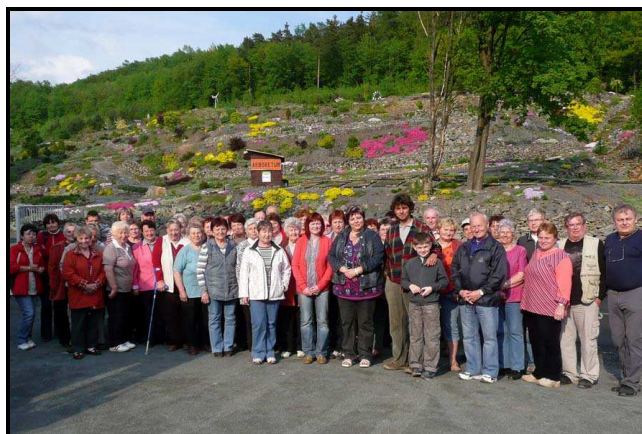
Účastníci zájezdu na Floru Olomouc 29.4. zaplnili celý autobus. Dokonce se na všechny zájemce ani nedostalo.

Dokažte, že i Vy umíte něco vypěstovat! To ale nestačí, musíte se přihlásit !!