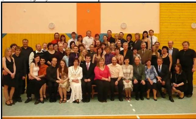
Pět sobotních večerů trávilo 30 manželských a partnerských párů v sokolovně zlepšováním svého tanečního umění.