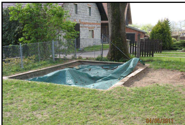
4. pískoviště lemují uhníla prkna a písek se musí hledat dost hluboko.