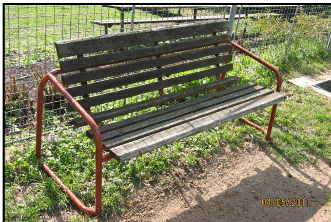
3. Míjíme ošuntělou lavičku s chybějícími díly.