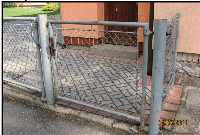
1. Vítá Vás branka - šedý nátěr, místy rezavý, rozbitá klika a vrzání.