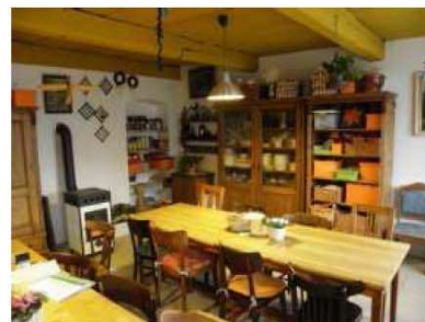
Zrekonstruované zázemí občanského sdružení Šťastný domov

Své projekty v minulém čtvrtletí dokončili také dva podnikatelé, kteří s poskytnutou 60% dotací modernizovali vybavení svého podniku.