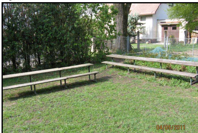
2. Shnilé lavice a stolky. Na těch už se asi svačit ani malovat nedá.