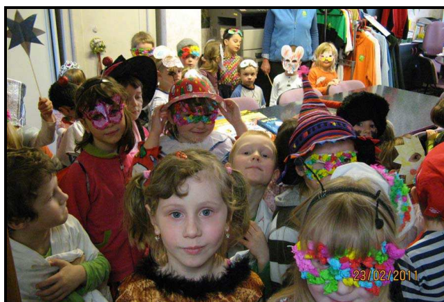
Masopustu nám na obecní úřad přišly připomenout děti z mateřské školy.