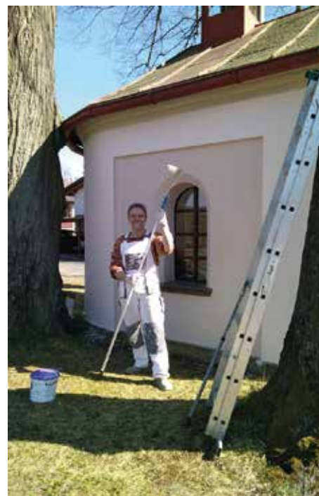
Do nového kabátu se před Srazem rodáků oblékla i kaplička.