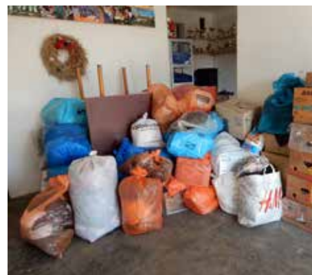
V březnu se plnila obecní garáž sbírkami pro potřebné. V prvním případě pro postižené válkou na Ukrajině, v druhém případě pro Diakonii Broumov.