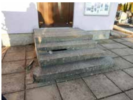
Schody u márnice se začaly rozpadat, s opravou pospícháme jak jinak, než do Srazu rodáků.