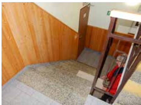
Po nových schodech půjdete také do zasedací síně i ubytovny.